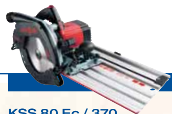
KSS 80 Ec / 370

Kompletní verze v kufru Elektronika s nastavením otáček, s paralelním dorazem, v MAFELL-MAXu