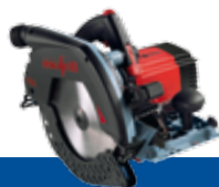
K 85 Ec

Vstupní model s cenovou výhodou S elektronikou, v kartonu