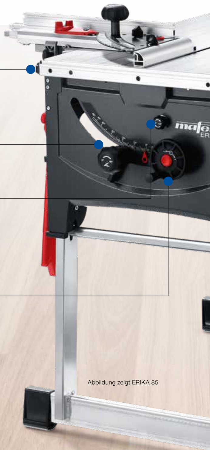
Abbildung zeigt ERIKA 85