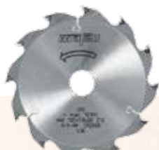
Lama da taglio in HM

La nuova sega troncatrice KSS 40 18M bl unisce tutti i vantaggi dell'ormai collaudata KSS 300 con la praticità delle batterie ad alte prestazioni. La macchina è caratterizzata da un'elevata potenza e un'ampia gamma di accessori.