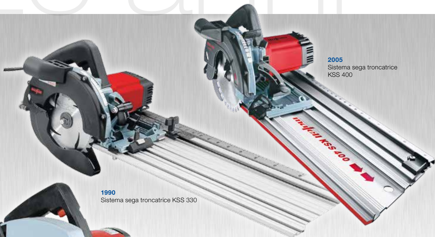
2005 Sistema sega troncatrice KSS 400