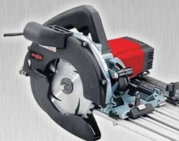
1990 Sistema sega troncatrice KSS 330