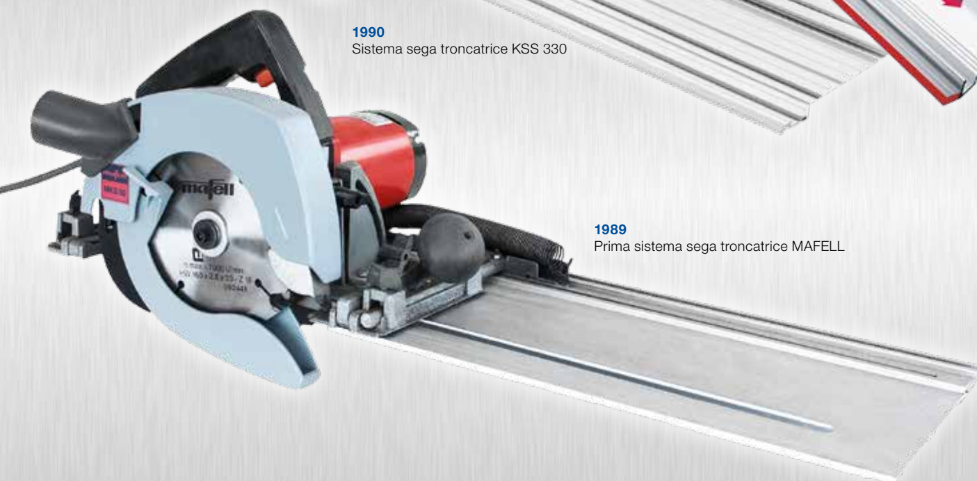
1989 Prima sistema sega troncatrice MAFELL

Chi ha già utilizzato una sega troncatrice con guida MAFELL lo sa bene: quasi impossibile immaginarsi un giorno di lavoro senza la KSS. Infatti è un utensile che non cambierà solo il vostro lavoro ma anche il vostro approccio. Provate voi stessi, seguite il vostro istinto.