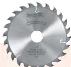
Lama da taglio in HM

120 x 1,2/1,8 x 20 mm Z 24, WZ universale per legno