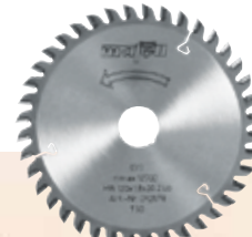
Lama da taglio in HM

120 x 1,2/1,8 x 20 mm Z 40, TR per laminati