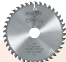
Lama da taglio in HM

120 x 1,2/1,8 x 20 mm Z 40, FZ/TR per tagli precisi per legno