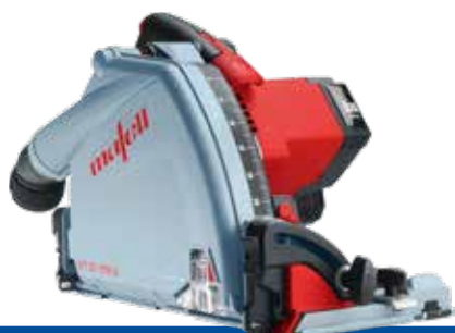
MT 55 18 M bl