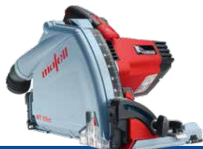
MT 55 cc