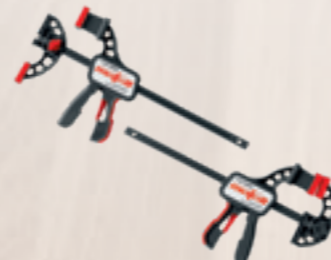
Eenhandsklem F-SZ 180MM 2 stuks, voor het vastklemmen van de liniaal Best.-nr. 207770