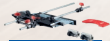
Bovenfreesadapter LO-FA Best.-nr. 207200