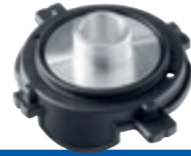
Kopieerring Ø 17 mm Best.-nr. 209851