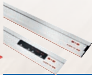
Geleidingsliniaal F Benaming Lengte Best.-nr. F 80 0,80 m 204380 F 110 1,10 m 204381 F 160 1,60 m 204365 F 210 2,10 m 204382 F 310 3,10 m 204383