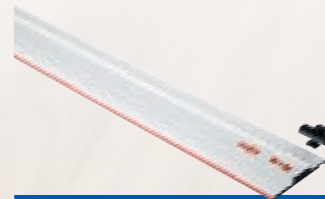
Geleidingsliniaal LR Benaming Lengte Best.-nr. F 80-LR 0,80 m 207600 F 160-LR 1,60 m 207601