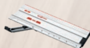
Versteekaanslag F-WA Best.-nr. 205357