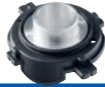
Kopieerring Ø 24 mm Best.-nr. 209850