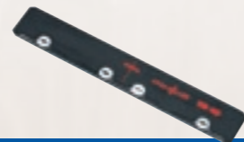
Verbindingsstuk F-VS voor het verbinden van twee geleidingslinialen Best.-Nr. 204363