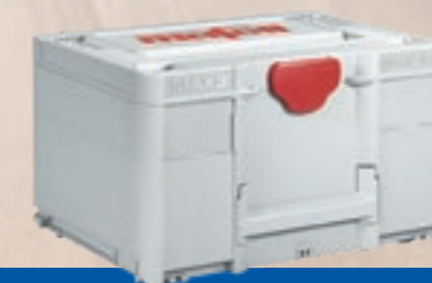
MAFELL MAX 3