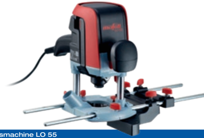
Bovenfreesmachine LO 55