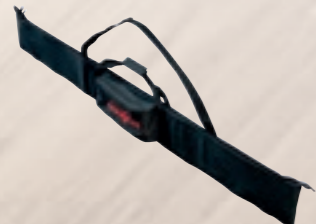
Tas voor geleidingslinialen Tas voor geleidingslinialen F 160 voor geleidingslinialen tot 1,6m lang Best.-nr. 204626