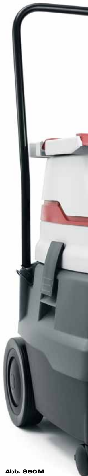
Abb. S50 M