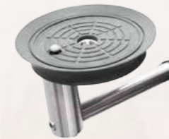
Vakuumplatte D 160