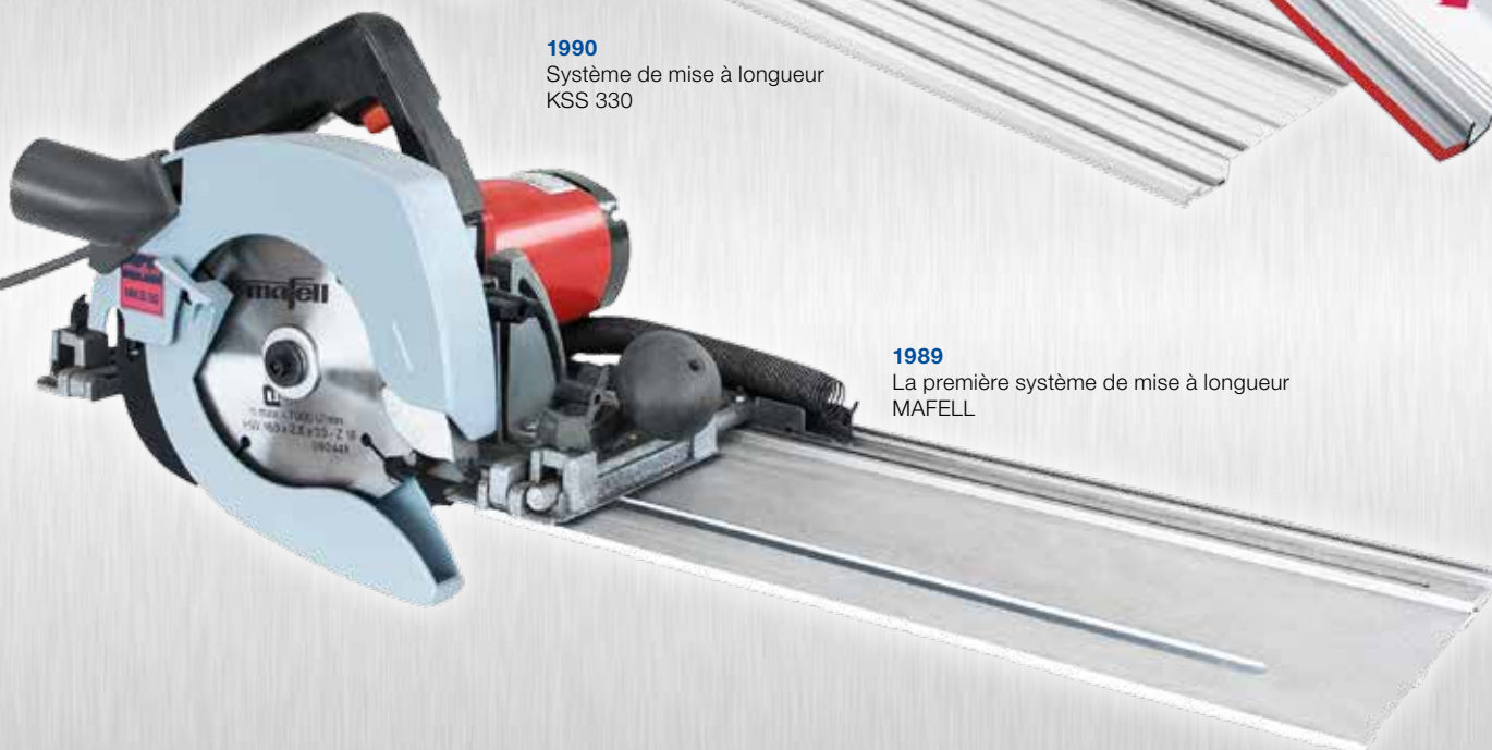
1990 Système de mise à longueur KSS 330