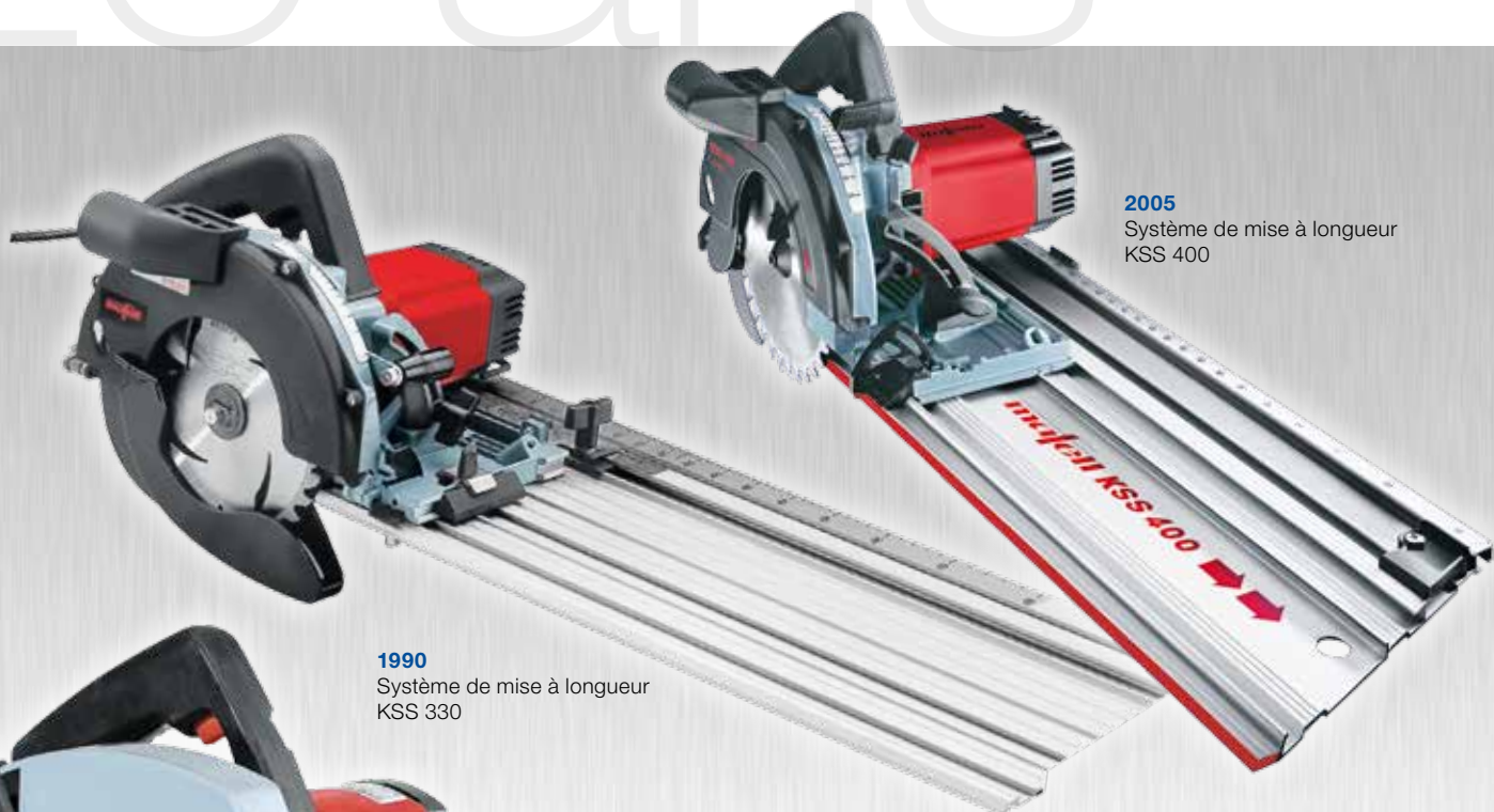
2005 Système de mise à longueur KSS 400