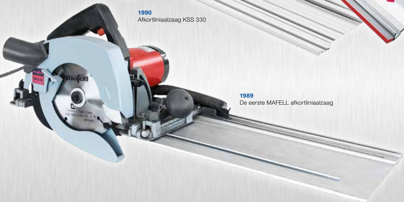
1989 De eerste MAFELL afkortliniaalzaag

Wie eenmaal met een MAFELL afkortliniaalzaag heeft gewerkt, die komt snel tot de conclusie dat de KSS niet meer uit de dagelijkse praktijk weg te denken is. Een machine die niet allene Uw werk maar ook Uzelf zal veranderen. Overtuigt U Uzelf en volg Uw instinct.