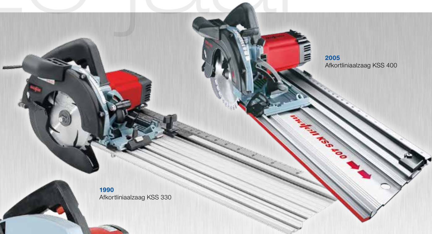
2005 Afkortliniaalzaag KSS 400