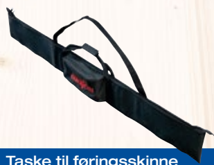
Taske til føringsskinne

Taske til føringsskinne F 160 til føringskinner op til 1,6 m længde Best.-nr. 204626