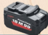
Akku PowerTank 18 M 99

APS 18 M, 18V Hurtigoplader APS 18 M+ Best.-nr. 094453 Best.-nr. 094439