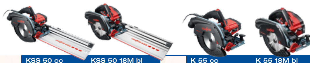
KSS 50 cc