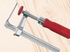
Skruetvinge F-SZ 100MM

2 styk, til fiksering af skinnen på emnet Best.-nr. 205399