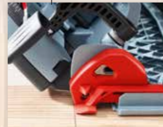
INDICATORE DEL TAGLIO

Le forti luci al LED permettono di illuminare bene la zona di lavoro.