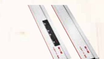
Barra guida F