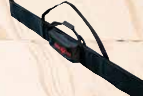
Borsa per barra guida

APS 18 M, 18 V Caricabatteria rapido APS 18 M+ Cod. art. 094453 Cod. art. 094439