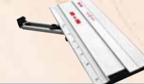
Battuta angolare F-WA

lunghezza di taglio max. 770 mm Cod. art. 204378