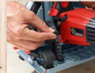
SISTEMA PER TAGLI INCLINATI

L'innovativo indicatore del taglio segue automaticamente l'inclinazione della macchina indicando quindi sempre la direzione del taglio corretta.