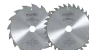
Lama da taglio in HM per KSS 60 18M bl