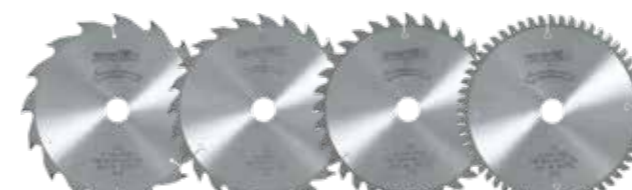
Lama da taglio in HM per KSS 60 cc / K 65 cc

Con la nuova sega circolare multiuso della classe 60/65 mm potete affrontare qualsiasi lavoro. Grazie alla vasta gamma di accessori speciali la vostra nuova sega troncatrice con guida o sega circolare a mano si potrà adattare a qualsiasi tipo di applicazione.