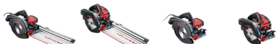
KSS 60 cc