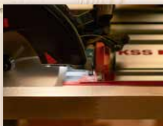
LUCE DI LAVORO AL LED

Regolando la sporgenza della lama dal piano la protezione mobile della lama si aziona automaticamente e garantisce maggiore confort e sicurezza nei tagli a immersione e nei tagli trasversali.