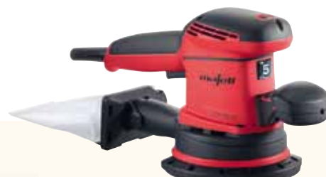
EVA 150 E / 5