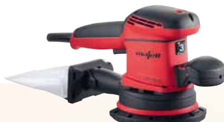
EVA 150 E / 3